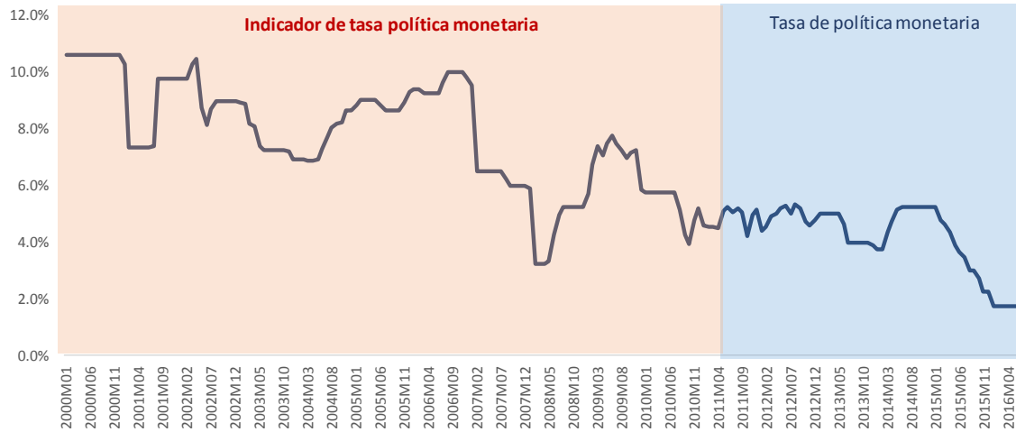
Gráfico1 Costa Rica: Tasa de política monetaria